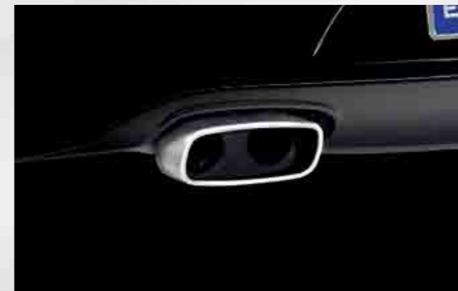
Cola de escape gasolina y diésel: acabado mate pulido con doble fijación. Petrol and diesel exhaust pipe: Polished matt finish with double anchorage points. Ponteira de escape gasolina e diesel: acabamento mate polido com dupla fixação. 3R0072000