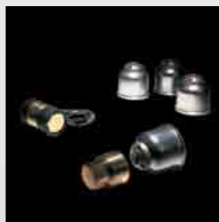
Juego tornillo antirrobo rueda.