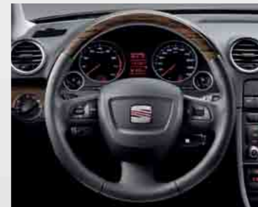
Volante piel acabado en madera Wengué.

Wenge wood finish leather steering wheel.