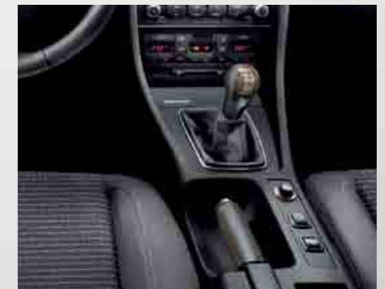
Pomo de cambio con carcasa superior acabada Wengué combinado con piel negra.

Stick shift with upper framework in Wenge finish, combined with black leather.