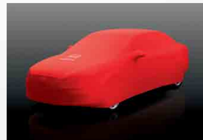
Funda elástica roja o negra con logo frontal blanco SEAT sobre el capó. Elastic red or black cover, with white SEAT logo in the front, over the hood. Capa elástica vermelha ou preta com logo frontal branco SEAT no capó. 3R0061701 / 3R0061703