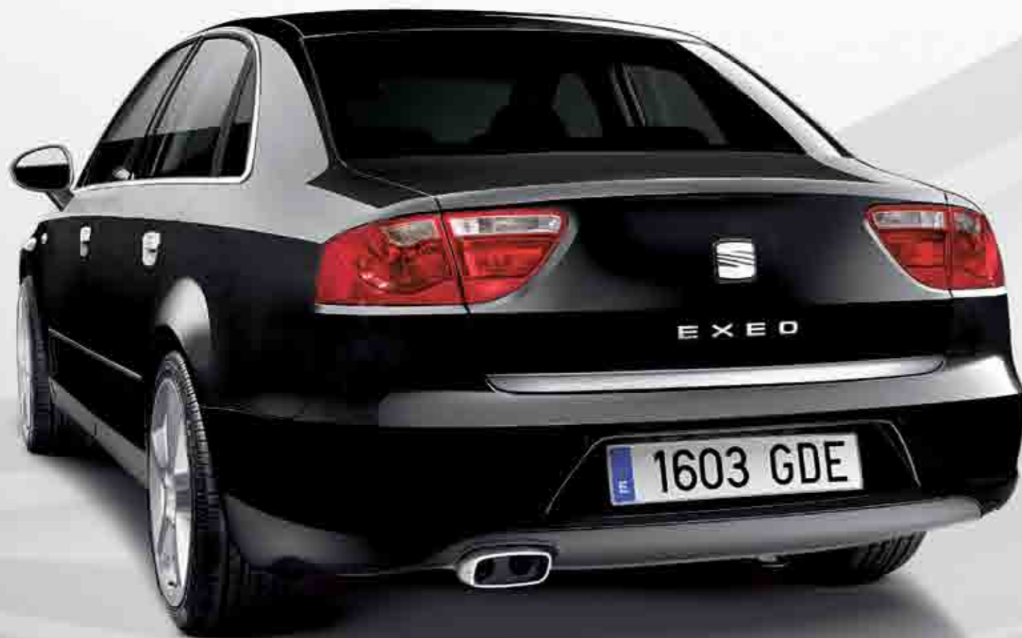
Moldura portón. Brillo o mate. Door frame. Shiny or matt finish. Moldura porta da mala. Brilho ou mate. 3R0071350 / 3R0071350A

Ser elegante não significa deixar de lado a emoção. Com os pedais e apoio de pés desportivos de alumínio, a ponteira de escape em aço polido personalizado com o logótipo da SEAT Sport e a moldura da porta da mala cromada, poderá dotar o seu Exeo de todo o desportivismo de um veículo. Além disso, pode montar o conjunto de pára-choques desportivos que o aproximam ao asfalto para desfrutar de uma intensa condução em cada curva.