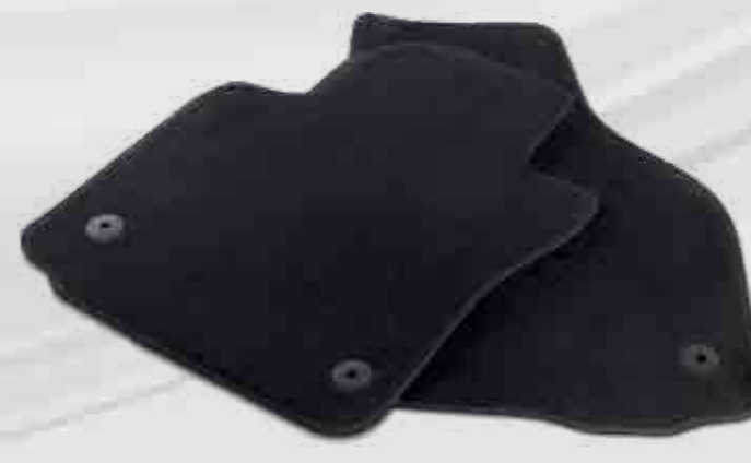
Juego de dos piezas delanteras. Alfombra textil de tacto suave y diseño liso. Set of 2 front mats. Fabric mat, soft touch and smooth design. Jogo de duas peças dianteiras. Tapete têxtil de tato suave e design liso. 3R1061625 9AM