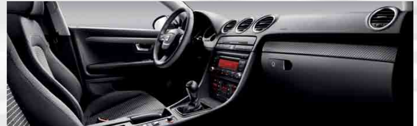
Decorativo interior en fibra de carbono, formado por 6 piezas (salpicadero y paneles puerta), acabado carbono mate.

Interior decorative element in carbon fiber, made up of 6 pieces (dashboard and door panels), matt carbon finish.