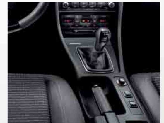
Pomo cubierto de piel. Carcasa superior color negro piano combinado con piel negra.

Leather covered stick shift. Upper framework in piano black with black leather.