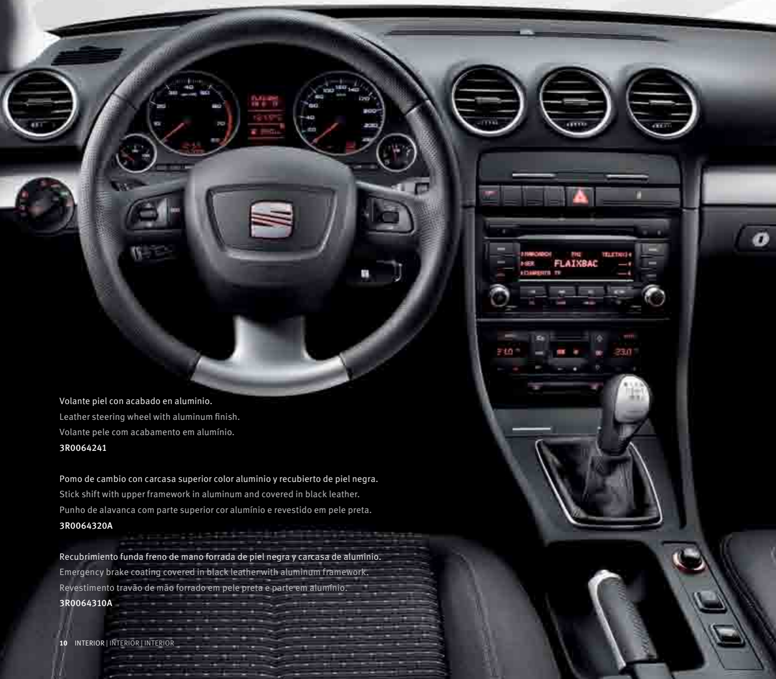
Volante piel con acabado en aluminio.

Leather steering wheel with aluminum finish.