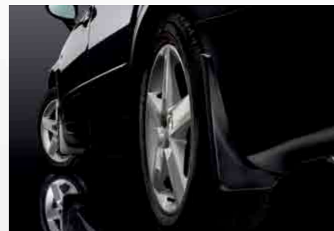
Faldillas delanteras y traseras. Front and rear splash guards. Guarda-lamas dianteiros e traseiros. 3R0075111 / 3R0075101