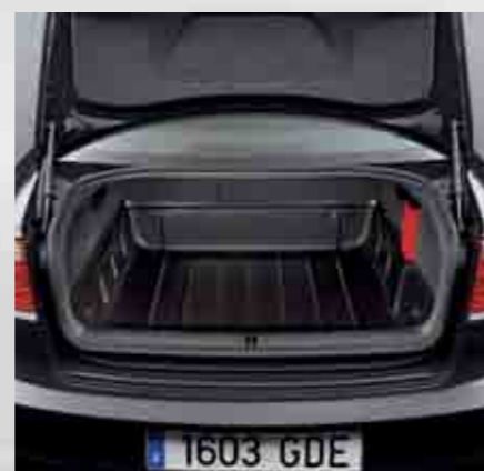
Cubeta protectora maletero. Protective trunk tray. Bandeja protetora da mala. 3R0061201