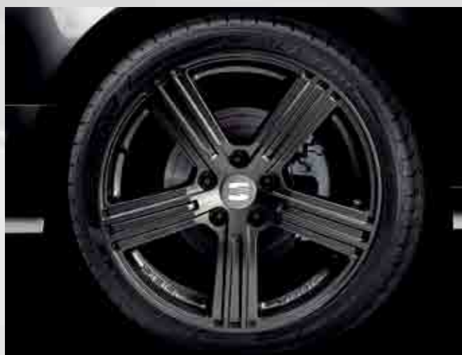
Antracita DV 180: Llanta de aleación ligera de aluminio, 5 radios, color antracita. Tamaño 8x18" ET42.

DV 180 Anthracite: 5-spoke light aluminum alloy rim in anthracite. Size 8x18" ET42.