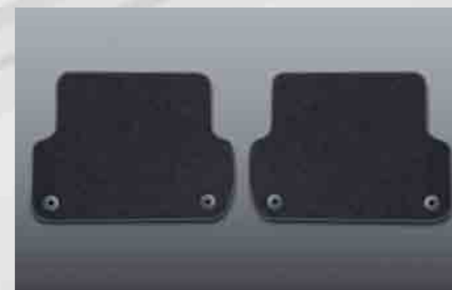
Juego de dos piezas traseras. Set of 2 rear mats. Jogo de duas peças traseiras. 3R0061625 9AM