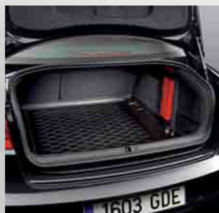
Bandeja protectora flexible. Flexible protective tray. Bandeja protetora flexível. 3R0061200