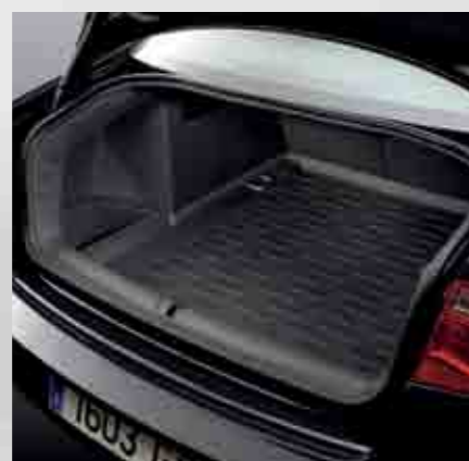
Bandeja antideslizante. Non-slip trunk tray. Bandeja antiderrapante. 3R0061160