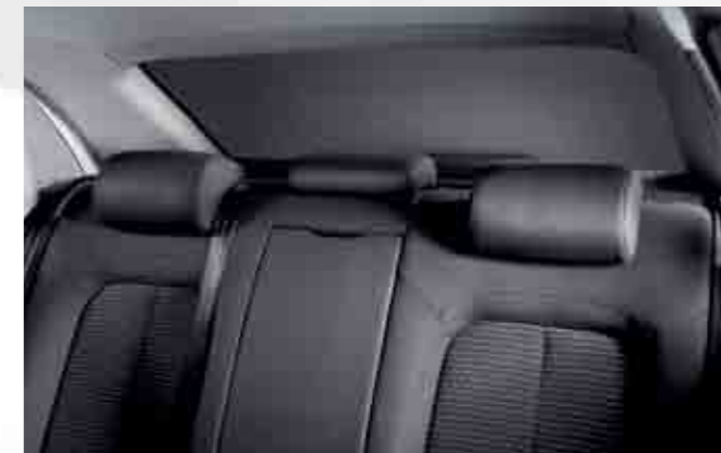
Cortina solar posterior. Rear sunshade. Cortina para-sol traseira. 3R0064100