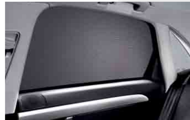
Cortina solar lateral. Side sunshade. Cortina para-sol lateral. 3R0064100A