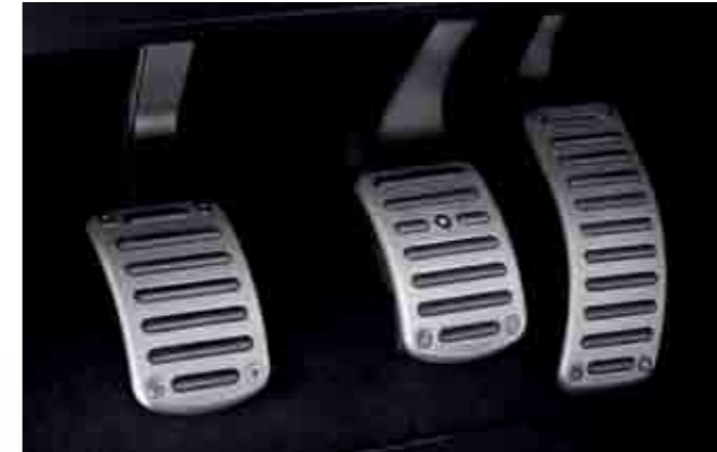
Pedales deportivos de aluminio GI/GD antideslizantes. Refuerzan la conducción deportiva. Anti-slip aluminum GI/GD sports pedals. They reinforce sports driving. Pedais desportivos de alumínio GI/GD antiderrapantes. Reforçam a condução desportiva. 3R0071700 / 3R2071700