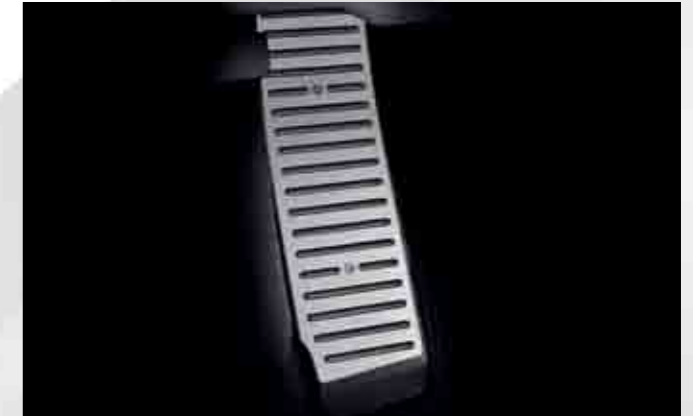
Reposapiés fabricados en aluminio/goma para mejor agarre. Footrests: Made in aluminum/rubber for better grip. Apoio de pés fabricados em alumínio/borracha para melhor aderência. 3R0071750