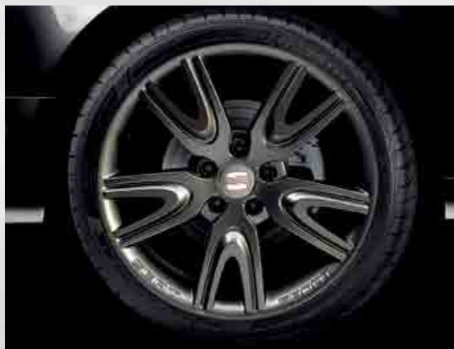
Antracita DV 179: Llanta de aleación ligera de aluminio, 5 radios, color antracita. Tamaño 8x18" ET42.

As jantes do seu SEAT Exeo são um detalhe chave para realçar a sua classe. Na SEAT Acessórios oferecemos-lhe uma gama exclusiva de jantes de 18" para o seu Exeo, com um design mais atrevido e de máxima qualidade. As jantes são de liga leve e com uma resistência que suporta os mais duros testes. Como todos os produtos da SEAT Acessórios: design e fiabilidade.