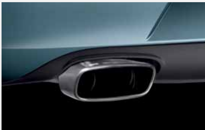
Cola de escape gasolina y diésel. Acabado mate pulido con doble fijación. Gasoline and diesel exhaust pipe. Polished matt finish with double anchorage points. Ponteira de escape gasolina e diesel. Acabamento mate polido com dupla fixação.