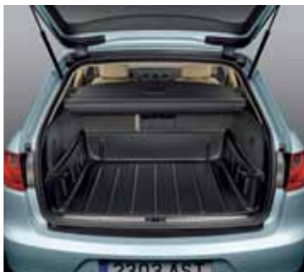
Cubeta protectora maletero. Protective trunk tray. Bandeja protectora da mala. 3R9061201