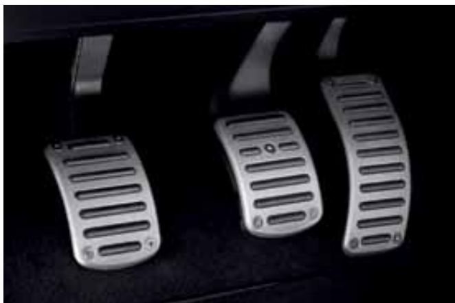
Pedales deportivos de aluminio. Refuerzan la conducción deportiva. Aluminum sports pedals. They reinforce sports driving. Pedais desportivos de alumínio. Reforçam a condução desportiva.