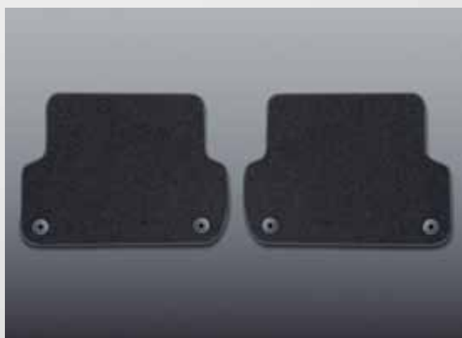
Juego de dos piezas traseras. Set of 2 rear mats. Jogo de duas peças traseiras. 3R0061625 9AM