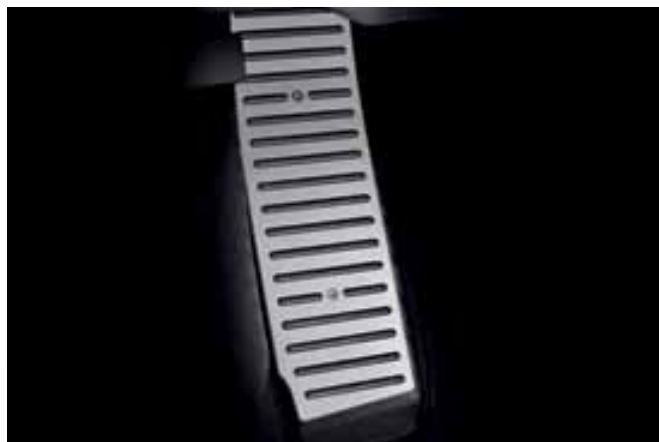
Reposapiés fabricados en aluminio/goma para mejor agarre. Footrests. Made in aluminum/rubber for better grip.

Apoio de pés fabricado em alumínio/borracha para melhor aderência.