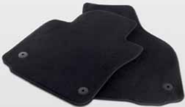
Juego de dos piezas delanteras. Alfombra textil de tacto suave y diseño liso. Set of 2 front mats. Fabric mat, soft touch and smooth design. Jogo de duas peças dianteiras. Tapete têxtil de tacto suave e design liso. 3R1061625 9AM