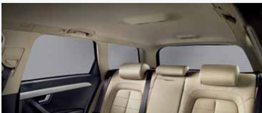
Cortina solar lateral. Side sunshade. Cortina pára-sol lateral. 3R9064100A