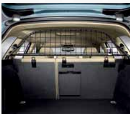
Rejilla separadora de carga. Load separator grille. Grelha separadora de carga. 3R9061202