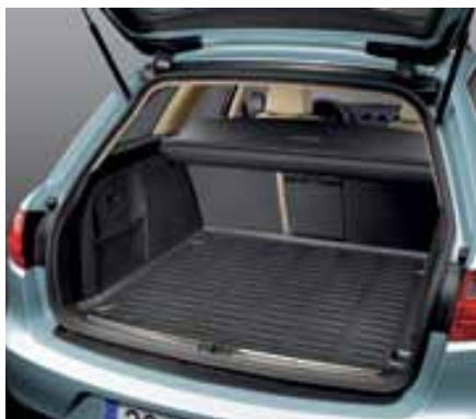
Bandeja protectora flexible. Flexible protective tray. Bandeja protectora flexível. 3R9061200