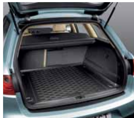
Bandeja antideslizante. Non-slip trunk tray. Bandeja anti-derrapante. 3R9061160